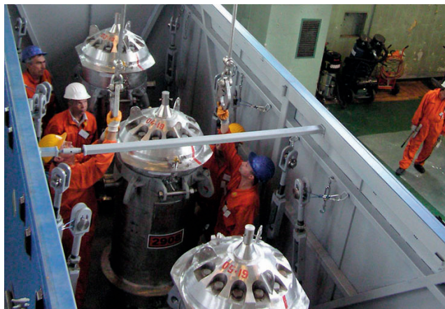
Рис. 1. ТУК-19 в грузовом ISO-контейнере Fig.1. TUK-19 in ISO-container

Результаты показали, что после воздействия на отдельную упаковку механических аварийных нагрузок (падения с высоты 9 м и на штырь с высоты 3 м, падения на упаковку тела массой 500 кг с высоты 9 м) исходная герметичность и прочность ТУК сохраняются. Обеспечиваются извлечение из ТУК чехла с ОТВС и последующая выемка сборок из чехла. При столкновении упаковки с жесткой преградой на скорости 90 м/с под многими углами происходит разрушение